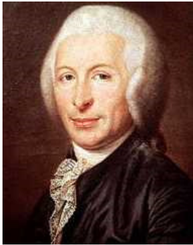
Жозефу Ињасу Гиљотену (фр. Joseph Ignace Guillotin )