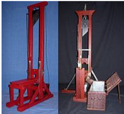
giljotina iz 1792.godine kojom je ubijen LUJ XVI.